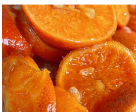
■たんかん (鹿児島・屋久島産)