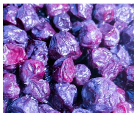
■ブルーベリー (国内産)