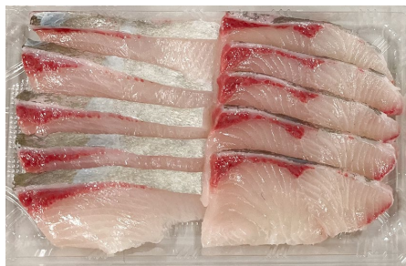
一般的なカンパチ