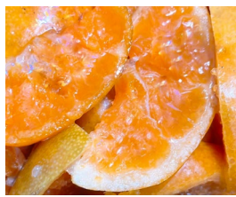
■みかん (鹿児島・福山産)