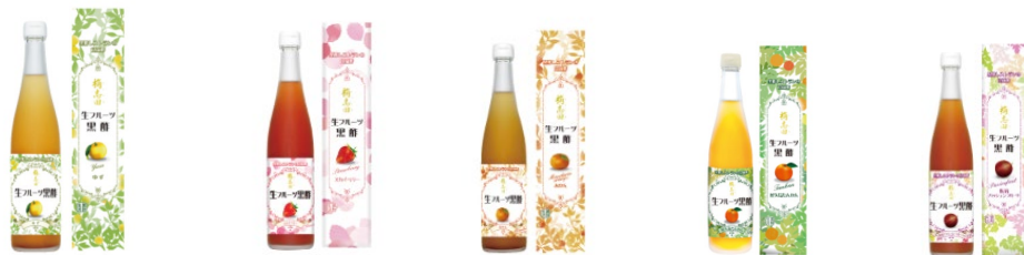
生フルーツ黒酢 ゆず 生フルーツ黒酢 スカイ 生フルーツ黒酢 みかん 生フルーツ黒酢 屋久島タンカン フルーツ黒酢 パッションフルーツ

“栂志田（かくだ）”とは、清冽な水が湧き出る福山の土地に、江戸時代の上級武士が開いたとされる「隠し田んぼ」から転じた「角志田」と呼ばれる地名が残っており、それが「栂志田（かくだ）」の名前の由来となりました。