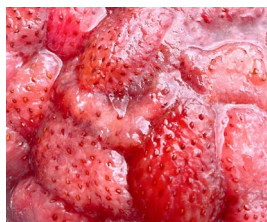
■スカイベリー (栃木県産)