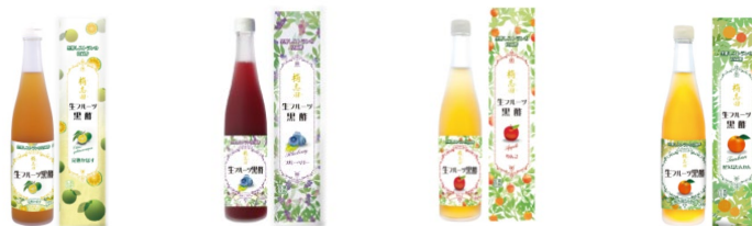
生フルーツ黒酢 完熟かぼす 生フルーツ黒酢 ブルーベリー 生フルーツ黒酢 りんご 生フルーツ黒酢 屋久島タンカン

日本初の黒酢レストラン「栂志田」では 黒酢を使った料理の他、国産の様々な フルーツと組み合わせた商品を製造・ 販売しています