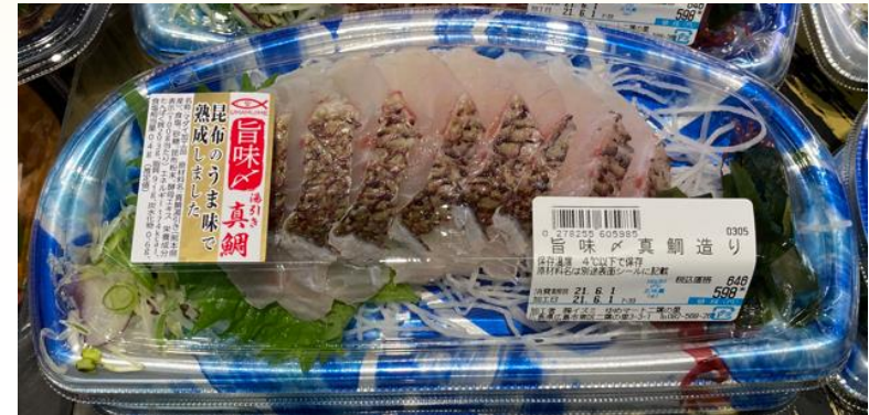
● 関東某SM (塩め盛り合わせ展開)