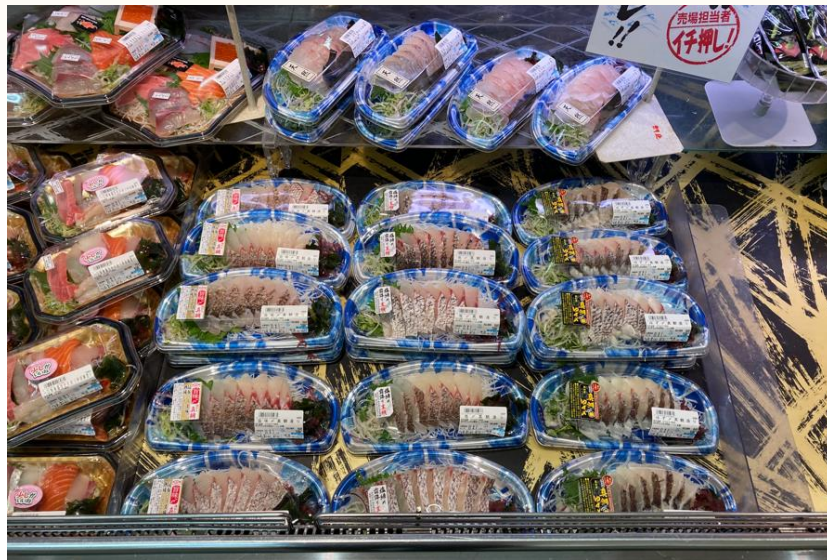
● 関西某SM (ゆずめ・塩め・旨味め刺身展開)